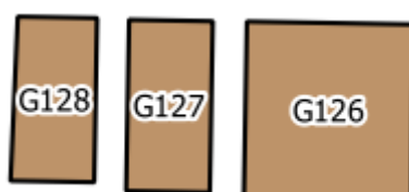
Obr.1: Ukázka zakreslení jednotlivých hrobových míst na mapě hřbitova

Grafickou část pasportu představují fotografie hrobů a přehledná mapa hřbitova s vyznačením všech hrobových míst. Atributy k jednotlivým mapovým listům se nachází v evidenčních tabulkách. Zakreslení hrobových míst bylo provedeno na podkladové vrstvě ortofotomapy ve formě pravoúhelníků s číslem hrobu uprostřed, viz ( Obr.1 ) pro hrobová místa, popř. ( Obr.2 ) pro kolumbárium.