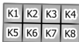
Obr.2: Ukázka zakreslení kolumbária na mapě hřbitova